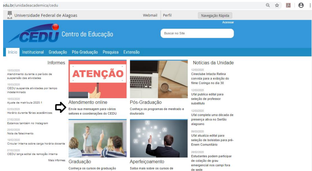
Imagem 1) Abertura da Página

um prazo máximo de 24 horas para responder, conforme imagem abaixo: